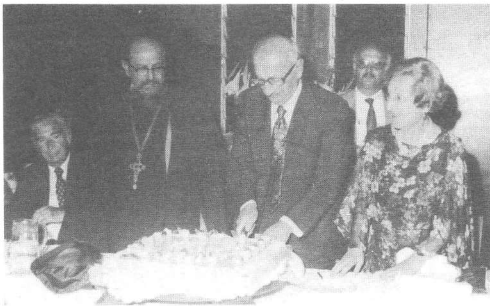
Նախագահ Ա. Մանուկեան եւ Տիկինը կը կտրեն յոբելիանական կարկանդակը, Սերբի տ՛Ալեքսանտրի սրահներուն մէջ կազմակերպուած հաշկերոյքին ընթացքին: