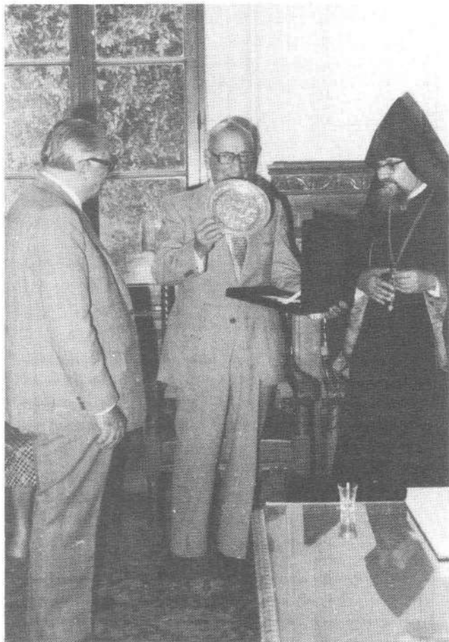
Աղեքսանդրիոյ Ազգ. Իշխմութեան յուշանուէրը, Նախագահ Ա. Մանուկեանի յանձնուած պահում:

Աւելի ուշ, «Մերքըլ արԱլեքսանդրի»-ի մէջ տրուած ճաշկերոյթին ընթացքին ելոյթ ունեցան Պրն. Վ. Սեֆերեան, Տօքթ. Կ. Անտուրեան Առաջնորդական փոխանորդ Իսահակ Մ. Վ. Ղազարեան, տեսաբ. Պ. Թէրզեան, Է. Մարտիկեան, Ս. Զարպահանէլեան: Վերջին խօսուող եղաւ ցիկանոս նախագահ Ալեք Մանուկեան, որ ըսաւ.