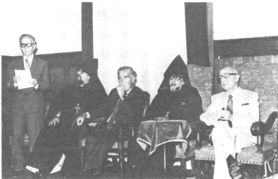
Մեծարգոյ հիւրերը Գահիրէի Ազգ. Առաջնորդարանի Դահլիճին մէջ:

Յեամիջօրէին՝ ցկեանս Նախագահ Ալեք Մանուկեան այցելեց Հայ Կաթողիկէ Պատրիարքարան, որ ընդունուեցաւ Վիճակաւոր Արհիապատիւ Ռաֆայէլ Եպս. Պաշեանի, տեարք Պ. Պետիկեանի, Ժ. Միքայէլեանի եւ ուրիշ համայնքային ղեկավարներու կողմէ: