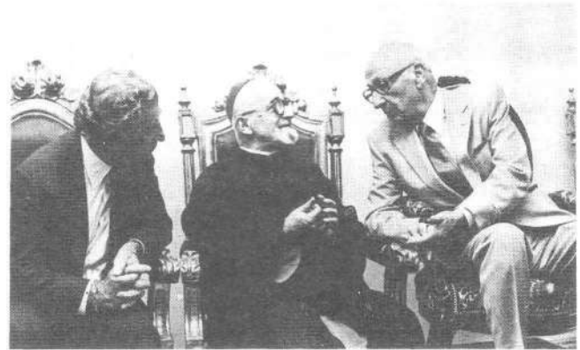
Մեծարգոյ հիւրերը Գահիրէի Հայ Կաթողիկէ Առաջնորդարանին մէջ:

Յեամիջօրէին՝ ցկեանս Նախագահ Ալեք Մանուկեան այցելեց Հայ Կաթողիկէ Պատրիարքարան, որ ընդունուեցաւ Վիճակաւոր Արհիապատիւ Ռաֆայէլ Եպս. Պաշեանի, տեարք Պ. Պետիկեանի, Ժ. Միքայէլեանի եւ ուրիշ համայնքային ղեկավարներու կողմէ: