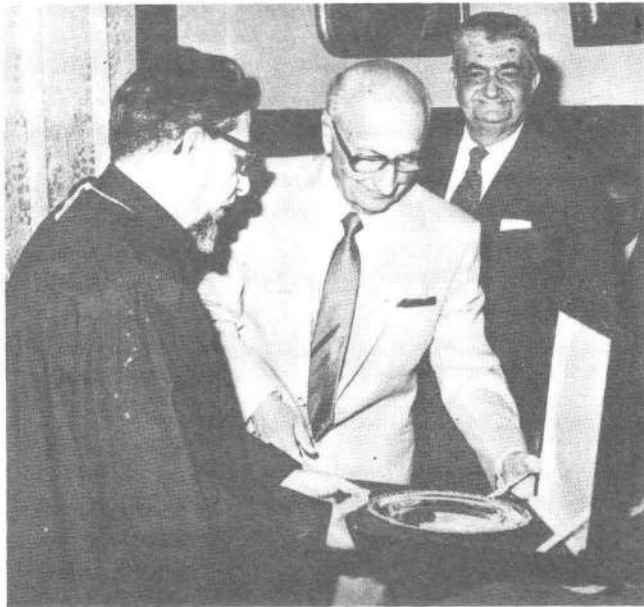
Առաջնորդ Սրբազան Հայրը Գահիրէի Ազգ. Իշխանութեան կողմէ՝ Նախագահ Ա. Մանուկեանի կը յանձնէ յուշանուէր մը:

Շնորհակալութիւն՝ մեզի հանդէպ ցուցաբերած ջերմ ու անկեղծ հիւրընկալութեան համար եւ յաջողութիւն բոլորիդ: