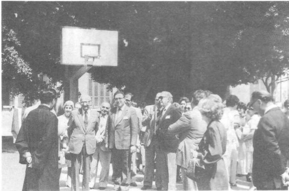
Մեծարգոյ հիւրերը Հելիոպոլսոյ Նուպարեան Ազգ. Վարժարանի բակին մէջ: