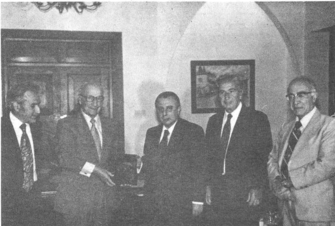
Կիպրոսի հանրապետութեան նախագահը կ'ընդունի ցկեանս նախագահ Ա. Մանուկեանը եւ իր շքախումբի անդամները, հանրապետութեան պալատին մէջ:

Վեհափառ Հայրապետին կուռ ճառը կը ներկայացնէր ամբողջութեամբ: