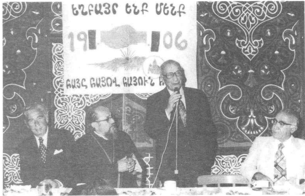
Նախագահ Ա. Մանուկեան խօսք կ'առնի Ադիսաբաբայի շ.Մ.Ը.Մ. Նուպարի դաշտին վրայ կազմակերպուած քէյսսեղանի ընթացքին: