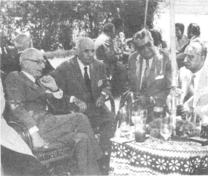
Նախագահ Ա. Մանուկեան Հելիպոլսոյ Հ. Մ. Ը. Մ. Մարզարանին մէջ: