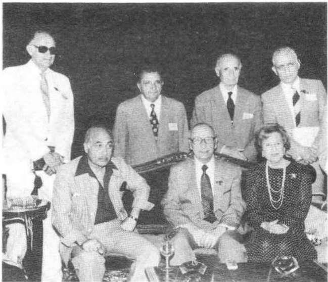
Մեծարգոյ հիւրեր եւ Հ.Մ.Բ.Մ.ի ղեկավար դեմֆեր Պօղոս Նուպարի ապարանքին մէջ:

Շնորհակալութիւն Ձեր հիւրընկալութեան եւ ազնիւ խօսքերուն համար եւ յաջողութիւն Ձեր ապագայի գործունէութեան: