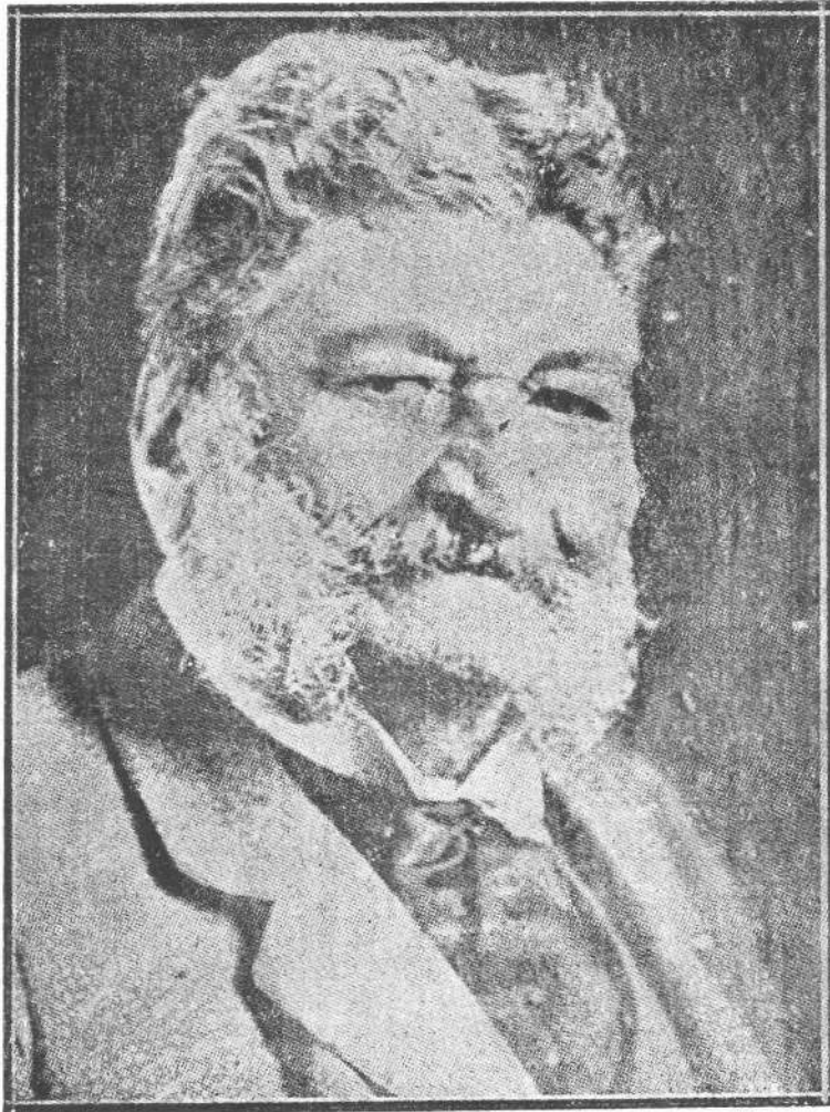
Ազգային բարեբար ԳՐԻԳՈՐ ԵՂԻԱԵԱՆ (1833—1911)