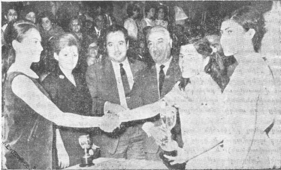
Յօրեկնական Յիսնամեակ Հ. Մ. Բ. Մ.ի — 1968