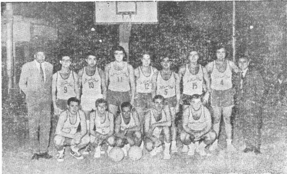
Յօբէյիմական Յիսնամեակ Հ. Մ. Ը. Մ. Ի — 1968

Երկրորդ մրցումը տեղի ունեցաւ Հ. Ե. Ը. Ի «Անդրանիկ» Ի մանչերու և Աղեքսանդրիոյ Հ. Մ. Ը. Մ. Ի համապատասխան խումբերու միջեւ: Մրցումին սկզբնաւորութենէն պէյրութահայ խումբին գերազանցութիւնը յատակ էր, որ առաջին կիսախաղը աւարտեց 29-17 կէտով: Երկրորդ կիսախաղն ալ սկսաւ աշխոյժ թափով մը և վերջացաւ 62-43 արգիւնքով: