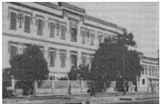
Գահիրէի Գալուստեան Ազգային Վարժարանը

Տիգրան Պապիկեանի մահէն ետք, շիրիմի մը կառուցման հարցը ծագած էր: Պերճ Թերզեան այդ առնչութեամբ կը գրէ. «Տիգրան Պապիկեանի մահէն ետք, Գահիրէի Ազգային Իշխանութիւնը, իբր յետմահու նուազագոյն յարգանքի արտայայտութիւն, ձեռնարկեց շիրիմի մը կառուցման աշխատանքներուն: Սակայն, դժբախտաբար, յանգուցեալին ընտանիքը, ցարդ անհասկնալի պատճառներով, արգելք հանդիսացաւ այս ձեռնարկին:»