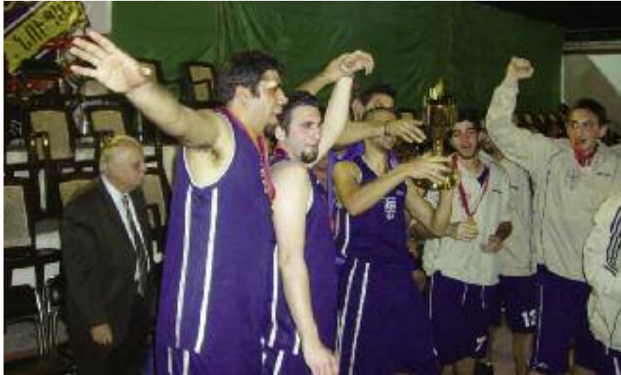
Հայկազեան Համալսարանի Պասքեթ պոլի տղոց յաղթանակի ուրախությունը

ՊԱՐ-ի վարչություններուն, որոնք հիւրասիրած էին զիրենք եւ այս տեսակ յաջող մրցաշարք մը կազմակերպած: Երբ հարցուցի, թէ ասկէ առաջ ու՞ր ճամբորդած են համալսարանի խումբերը, ըսաւ «2004-ին առաջին անգամ ըլլալով տղոց պասքեթպոլի խումբը Ֆրանսա «Tournoi des cinq ballons» մրցաշարքին մասնակցած է: Նոյն մրցաշարքին մասնակցած է նաեւ 2006-ին: Կրկին 2006-ին տղոց ֆութպոլի խումբը Barcelona գացած է»: