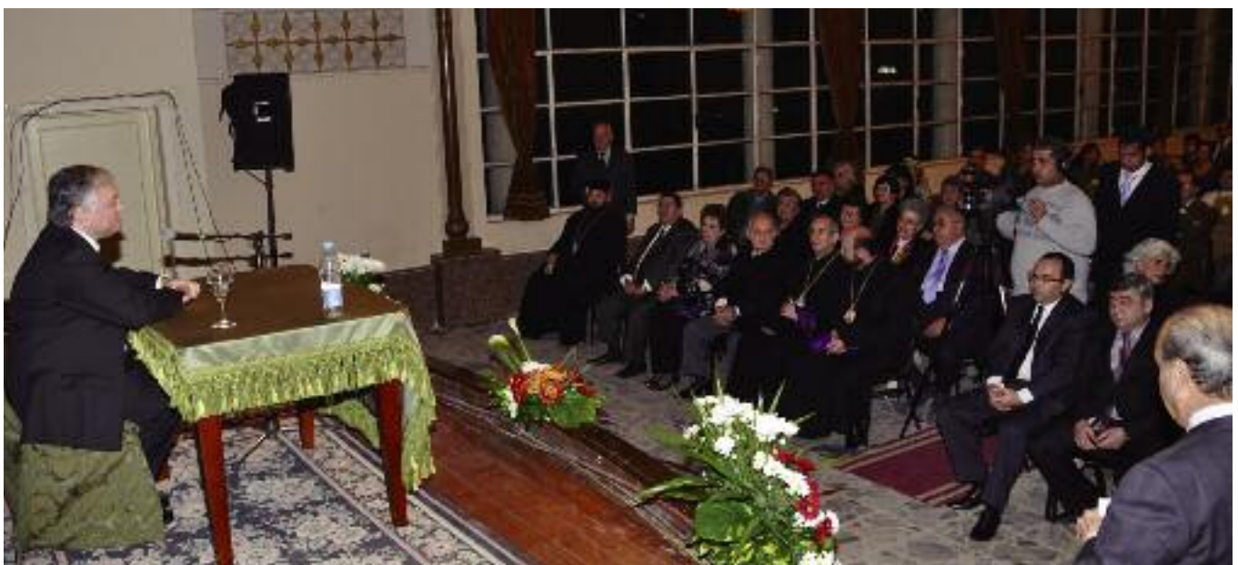
ՀՀԱԳ Նախարարը ելոյթի պահուն