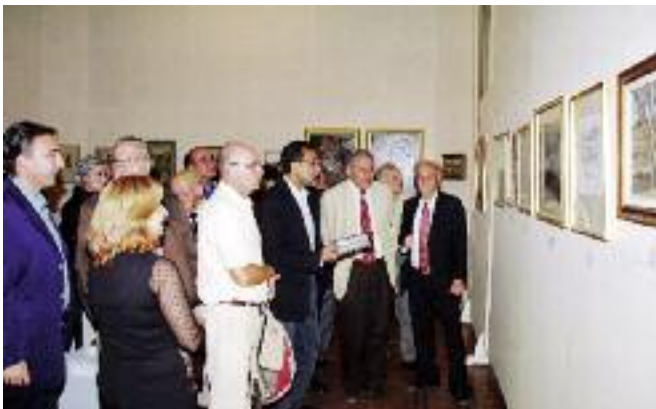
Յուցահանդէսի ներկաներէն մաս մը