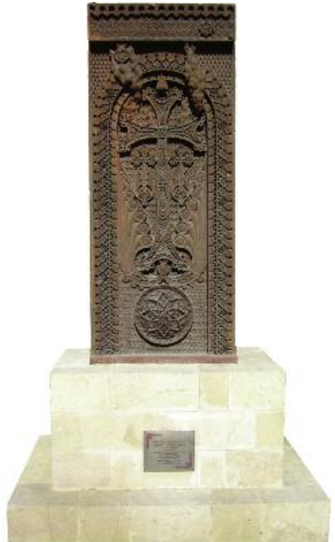
Մեծ Եղեռնի զոհերուն նուիրուած խաչքար-յուշարձանը Գահիրէի Ս. Գրիգոր Լուսաւորիչ եկեղեցիին շրջաբակին մէջ

«Հաստատուն մնանք հաւատի մէջ՝ աստուածասիրութեան, մարդասիրութեան, մեր արդար դատի: Հաստատուն մնանք հայրենի յիշատակները եւ ազգային աւանդները առաւել նախաձեռնութեամբ պահպանելու կամքի ու ձգտումի մէջ եւ միշտ ապրենք սիրով առ Աստուած, առ մեր Սուրբ եկեղեցին եւ հայրենիքը: Աղօթենք առ Տէրն Ամենակալ, որ ազգային, եկեղեցական մեր անդաստանում արգասաւորուեն եւ առատ պտուղներ բերեն մեր ժողովրդի համատեղուած ջանքերը՝ ի սեր մեր հայրենիքի եւ աշխարհասփիւռ հայ կեանքի, մեր լուսավառ գալիքի եւ ազգային մեր բոլոր իղձերի