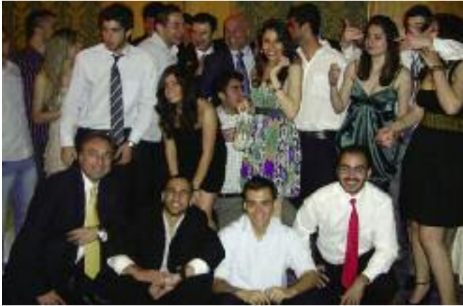
Պարահանդեսին ներկայ խումբ մը երիտասարդներ

Շուտով պարահարթակը լեցունեցաւ զոյգերով եւ երբ շուրջպարի եղանակները հնչեցին, երիտասարդներուն տրամադրուած սեղանները բոլորովին պարպուեցան: Ընդհանրապէս վիճակահանութիւնէն ետք պարահանդէս մը աւարտած կը նկատուի, այդ ճիշդ էր տարեցներուն համար որոնք խումբ-խումբ սկսան հրաժեշտ տալ. սակայն պարահարթակը բերնէ բերան լեցուն մսաց երիտասարդներով մինչեւ առաւօտեան առաջին ժամերը: Կը շնորհաւորենք ՅԱԸՄ ՆՈՒՊԱՐ-ի վարչութիւնը այս տեսակ յաջող պարահանդէս մը կազմակերպելուն համար: