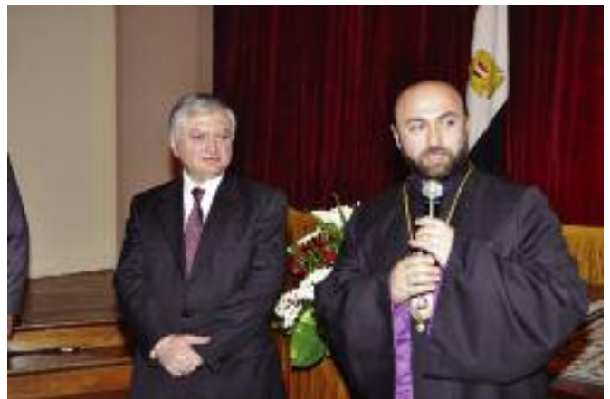
ՀՀԱԳ Նախարարին հետ հանդիպման աւարտին ելոյթ կ'ունենայ Եգիպտոսի Հայոց Առաջնորդը

ծունելութեան եւ Անդրկովկասի տարածաշրջանին մէջ խաղաղութիւն եւ կայունութիւն պահպանելու գործընթացին: