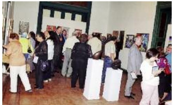
Յուցահանդէսի այցելուներէն մաս մը