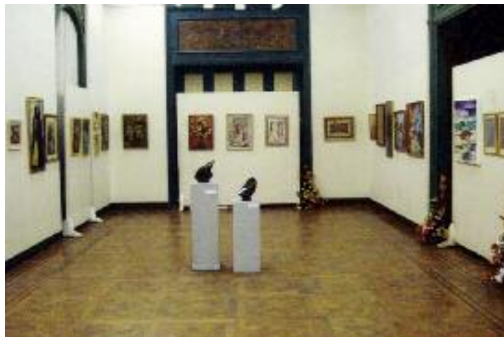
Նկարիչ Համբար Համբարեանի ծննդեան 100-ամեակին նուիրուած ցուցահանդէսին ցուցօնները