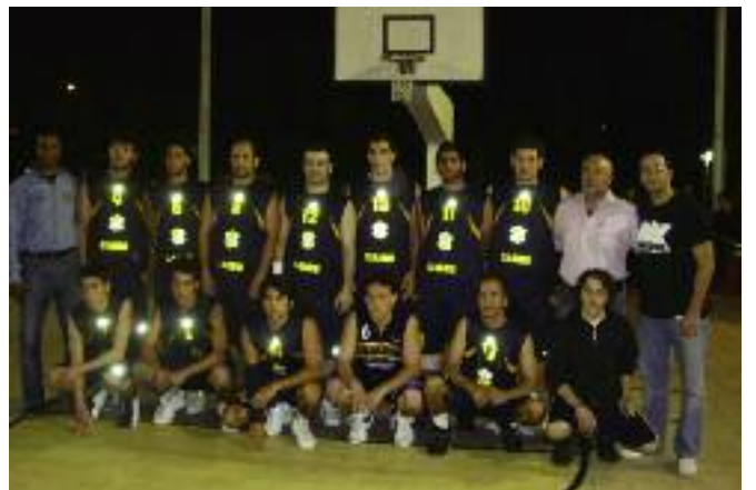
ՀԱԸՄ ՆՈՒՊԱՐ-ի պասքէթ պոլի խումբը

Ժողովուրդը անհամբեր կը սպասէր Հելիոպոլսոյ ՅԱԸՄ ՆՈՒՊԱՐ-ի եւ Հայկազեանի տղոց միջեւ կայանալիք աւարտական մրցումին, որ առաջին վայրկեանէն իսկ յայտնի էր թէ հետաքրքրական եւ անակնկալ վերջաւորութիւն մը պիտի ունենար, քանի որ երկու խումբերն ալ գրեթէ հաւասար մակարդակի էին: Հակառակ որ երեք կիսախաղերուն ՅԱԸՄ ՆՈՒՊԱՐ-ի տղաքը յաղթական էին, սակայն չորրորդ կիսախաղին բախտը փոխուեցաւ եւ բուն պայքարէ ետք մրցումը աւարտեցաւ ի նպաստ Հայկազեանին 84-81 արդիւնքով: Հիւրերը ստացան տէր եւ տիկին Նուպար Սիմոնեանի նուիրած բաժակը: Այս մակարդակի ու որակի մրցում մը խաղալը յաղթանակի նման գոհունակութիւն կը պատճառէր ունէր խումբի: Վարձքը կատար խումբին պատասխանատու եւ նախկին խմբապետ պր. Յակոբ Գարակեօզեանին եւ մարզիչ քաբթէն Ալաա Չահրանին: Այսպիսով մրցաշարքը հասած էր իր աւարտին: