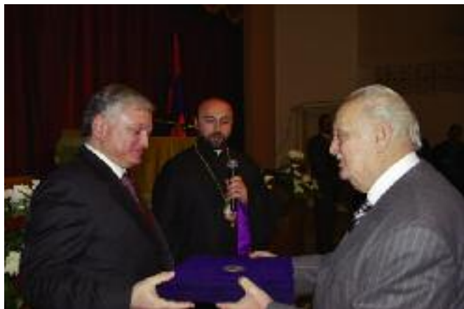
ՀՀԱԳ Նախարարը Գահիրէի Թեմական Ժողովի ատենապետին ձեռամբ կ'ընդունի եգիպտահայ գաղութին յիշատակի նուերը

ՀՀ Արտաքին գործերու նախարարին հետ տեղի ունեցած ժողովրդային այս հան-