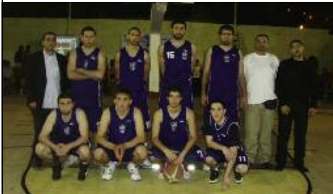
ՊԵՐՈՒԹԻ Հայկազեան Համալսարանի պասքեթպոլի տղոց յաղթական խումբը