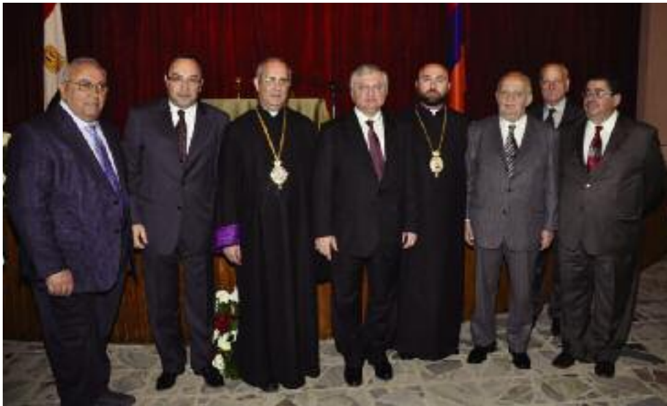
Կեդրոնը ՀՀԱԳ Նախարար Էդուարդ Նալպանտեան ձախէն աջ՝ տիար Պերճ Թերզեան, ՀՀ դեսպան, տոքթ. Ռուբէն Կարապետեան, Արհ. Տ. Գրիգոր Եպիսկոպոս Գուսան, Նախարարը, Գերշ Տ. Աշոտ Եպիսկոպոս Մնացականեան, տիար Անդրանիկ Մետրոպեան, տիար Նորայր Տօվլէթեան եւ տիար Օննիկ Պըլլքստանեան