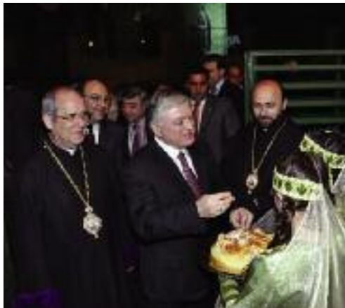
ՀՀԱԳ Նախարար Էդուարդ Նալպանտեան կը դիմաւորուի ականդակական աղ ու հացով

«Բարի երթ, անկոտրում կամք եւ կանաչ ճանապարհ Ձեր առաքելութեան» մաղթանքով, խօսքը ավարտեց տոքթ. Պայրամեան եւ հրաւիրեց Նախարարը ելոյթ ունե-