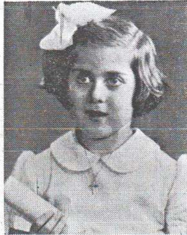
դեռա՞սի երջանաւարտուհի Մանկապարտէզէն: