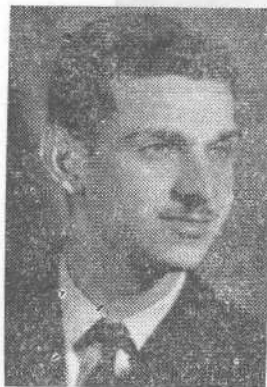
Գրիգորեան Պերն Մարօնիթ Երկրդ. վրժ.