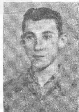
Մինասեան Աւետիս Մարօնիթ Երկրդ. վրժ.