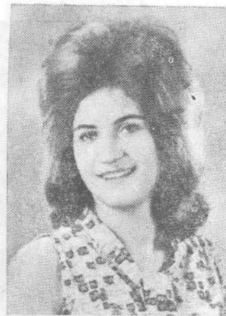
Խաչատուրեան Սօսէ Ամերիկէն Միջըն վրժ.