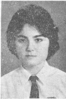
Վահրիանի Արսեան Ամերիկէն Միջըն վրժ.