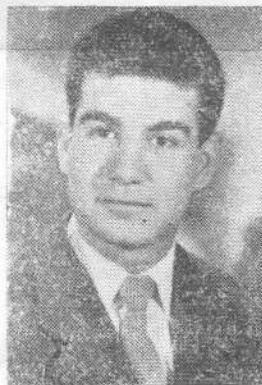
Մարտիրոսեան պերն Պետական Համալսարան