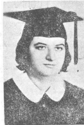
Գարմանեան Հիլտան Ամերիկեան Համալսարան.