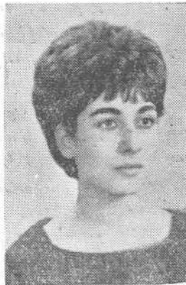
Մարգիւսեան Լիւսի Ամերիկէն Միջըն վրժ.