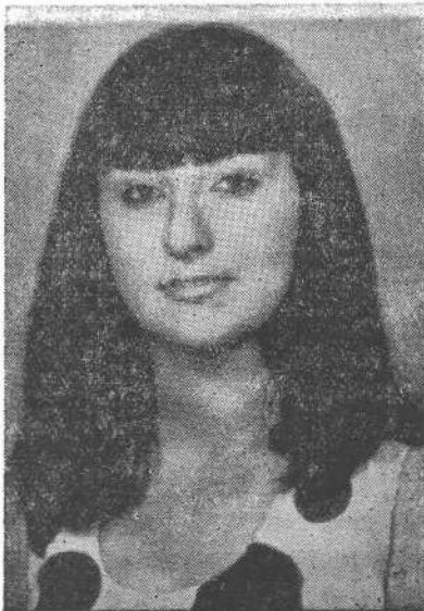
Օր. Զամբէրբէեան Լիւսի

Հանոյքն ունինք հաղորդելու, որ ներկայ տարեշրջանին ևս ունեցած ենք Գահիրէի մէջ յաջողութեամբ իրենց երկրորդական ուսման շրջանը բոլորած եր-