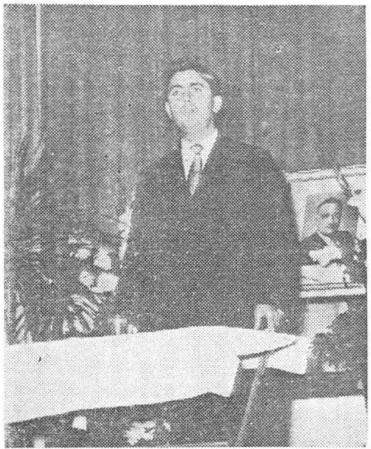
Վերապատուելի ՎԱՀԱՆ ԹՈՒԹԻԿԵԱՆ կը խօսի իր շատ գեղեցիկ բանախօսութիւնը որ կը խանդավառէ իր ունկնդիրները:

Կեդրոնը՝ մեծ մասամբ յատուկ հիմնադրումներու եկամուտէն: