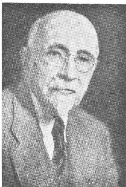
Վ Ա Լ Ա Ն Մ. Ք Ի Ի Ր Ք Ճ Ե Ա Ն

ղափարին սերմնացաններէն մէկը ըլլալու պատիւը: