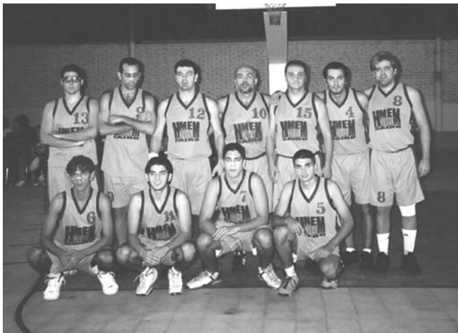
ՀՄԸՄ ՆՈՒՊԱՐԻ երեց տղոց խումբը