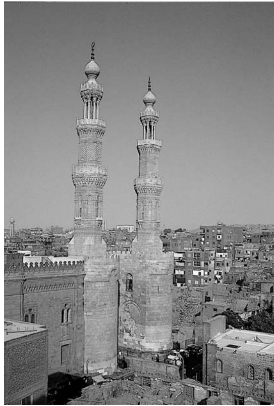
Վերականգնուած Պապ Չուէլյայի համայնապատկերը

Շնորհակալութիւն Նայիրի: Շնորհակալութիւն որ մեզի վերադարձուցիր մեզմէ հազարաւոր մղոն-ներ հեռու գտնուող ու դարերու պատմութիւն ունե-