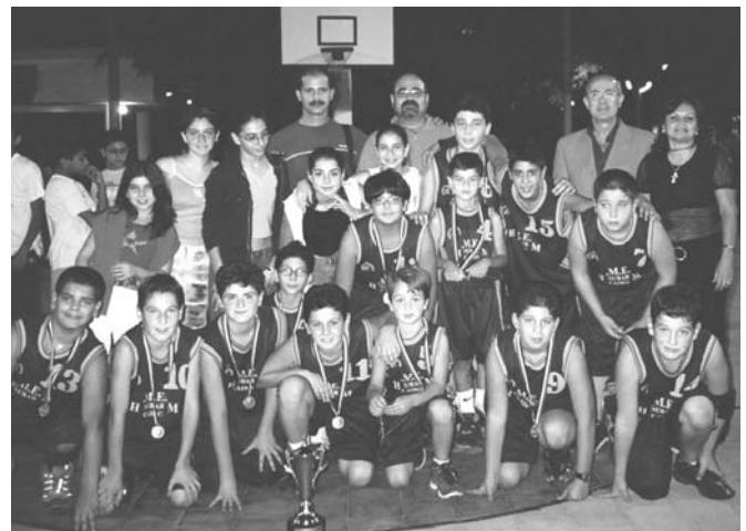
ՅՄԸՄ ՆՈՒՊԱՐԻ 14 տարեկանէն վար տողոց խումբը, պատասխանատուներու հետ

Կիրակի օր, նախքան երեք տողոց ավարտական մրցումը, կազմակերպուած էին երեք մրցումներ, որոնցմէ առաջինը՝ Գահիրեի ՅՄԸՄ ՆՈՒՊԱՐԻ եւ ԿԵԶԻՐԱ մարզարանի 18 տարե-