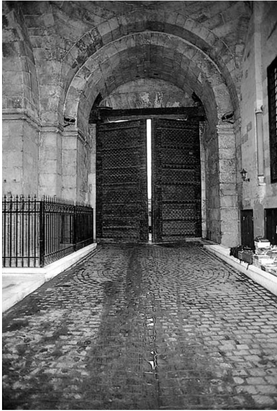
Պապ Չուէլյան վերականգնած

ոգիով, կառուցող հայազգի վարպետ շինարարով ու 2003-ին գայն վերականգնող ճարտարապետ Տոքթ. Նայիրի Համբիկեանով: