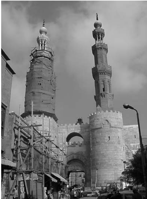
Պապ Չուէյլան վերաշինութենէն առաջ

ծունեութեամբ: Ան կառուցել տուած է բազմաթիւ յիշատակարաններ, որոնց մեծ մասը դարերու ընթացքին կորսուած է: Ան շինել տուած է նաեւ Գահիրէի երկրորդ պարիսպը - առաջինը աղիւսէ շինուած էր հրամանատար Կաուհարի կողմէ՝ պարիսպին երեք դմները, Պապ էլ Նասր, Պապ էլ Ֆութուհ եւ Պապ Չուէյլա, Պերկեուանի շուկան, մզկիթներ, եւայլն: