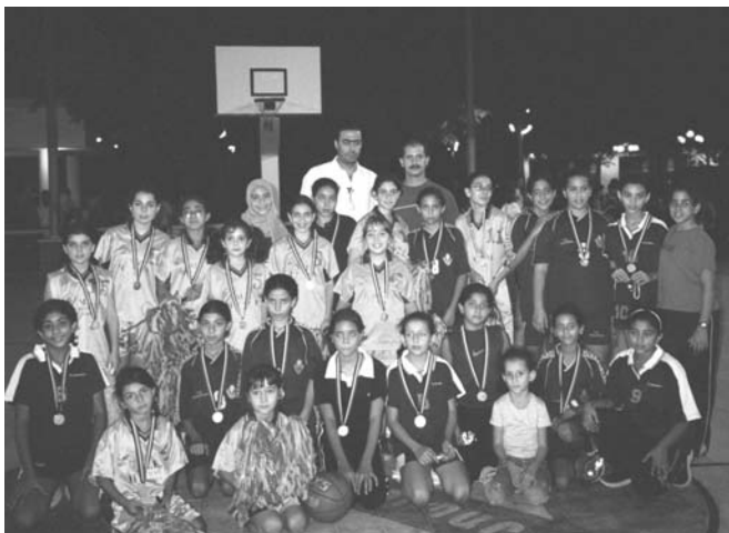
Գահիրեի ՅՄԸՄ ՆՈՒՊԱՐԻ եւ ՍԱՏԻՆԵԹ ՆԱՍՐԻ 12 տարեկանէն վար աղջիկներու պատասխանատուներուն հետ

Ուրբաթ, 3 Յոկտեմբերին տեղի ունեցան երկու մրցումներ, առաջինը՝ ՅՄԸՄ ՆՈՒՊԱՐ եւ ՍՐԲՈՒՅԻ ԹԵՐԵԶԱ խումբերուն միջեւ, իսկ երկրորդը՝ ՅՄԸՄ ԱՐԱՐԱՏի եւ ՅՄԸՄ ԿԱՍԵի: Յաղթական հանդիսացան ՅՄԸՄ ՆՈՒՊԱՐ եւ ՅՄԸՄ ԱՐԱՐԱՏ խումբերը: