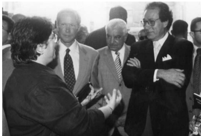
Տոքթ. Նայիրի Համբիկեան բացատրութիւններ կու տայ Եգիպտոսի մշակոյթի նախարար Տոքթ. Ֆարուք Հոսնիի, Եգիպտոսի մօտ ԱՄՆ դեսպան Տէյվիտ Ուէլշի եւ Հնութիւններու Բարձրագոյն Խորհուրդի ընդհանուր տնօրէն Տոքթ. Չահի Հաուասի

Արդարեւ 1998–2003, հսկայ աշխատանք տարուած է Պապ Չուէլայի 400 տարի անշարժ մնացած եւ 1.5 մէթր հողին մէջ խրած՝ իւրաքանչիւրը 4 թօն կշռող՝ երկաթեայ երեսով փայտէ դռներուն եւ շրջակայքին վերականգնման համար: