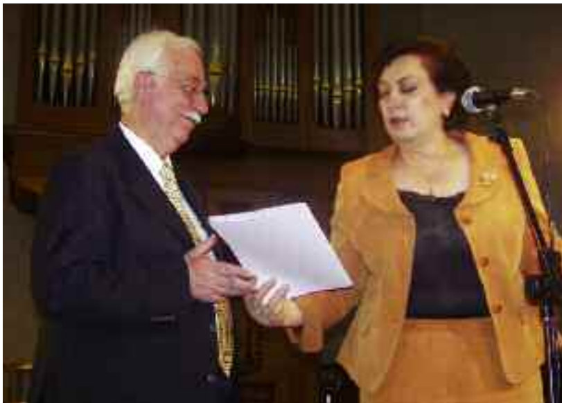
ՀՀ-ի Սփիւռքի Նախարար Հրանուշ Յակոբեան Տիար Ժիրայր Դանիելեանի կը յանձնէ պատուոգիրը

Ժիրայր Դանիելեան պարգեւատրուած է նաեւ ՀՀ Մշակոյթի Նախարարութեան, ՀՀ Գրողներու Միութեան պատուոգիրերով եւ ՀՀ Թատերական գործիչներու միութեան մետալով: