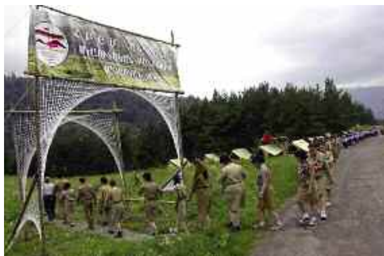
Հայաստանի Լոռիի մարզի Լերմոնտով գիւղին մէջ գտնուող ՀԲԸՄիութեան ճամբարը