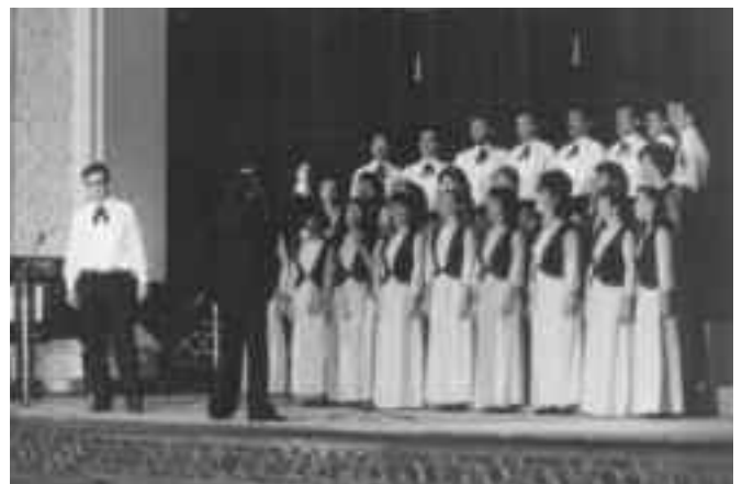
«Կռունկ» երգչախումբի ելոյթներէն նկարներ