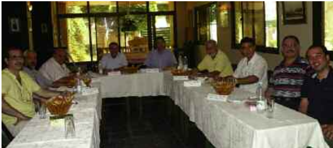
Եգիպտահայ մարզական ակումբներու ներկայացուցիչները ՀՄԸՄ Կամքի մէջ:

Մասնակցող 5 ակումբները համաձայնութեամբ պիտի ընտրեն կազմակերպիչ յանձնախումբ մը հետեւելու եւ կառավարելու համար մրցաշարքերուն մրցումները: