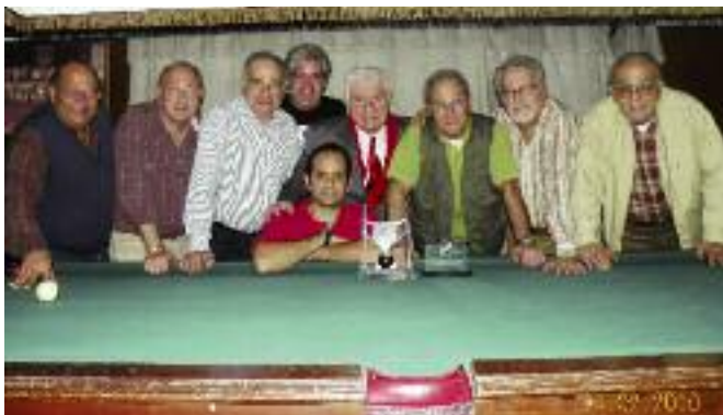
Մրցաշարքին մասնակիցներուն խմբանկարը