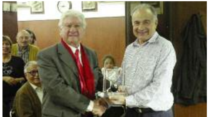
Գերրգ Սագայեան օրուան նախագահ Պերճ Թուլումպաճեանէ կը ստանայ մրցաշարքին բաժակը