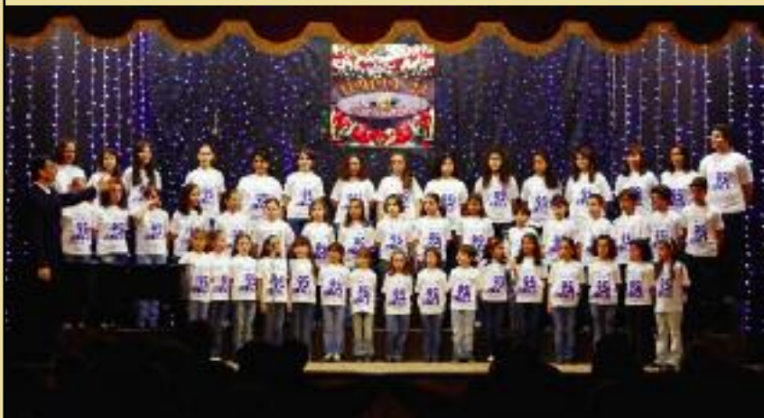
ՀԲԸՄ-ի «Ծիածան» եւ ՅՈՒՄԱԲԵՐ Մ. Ը.-ի «Ծաղկաստան» Մանկական Երգչախումբեր