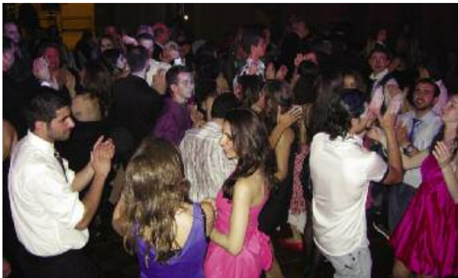
Երիտասարդութիւնը խրախճանքի պահուն