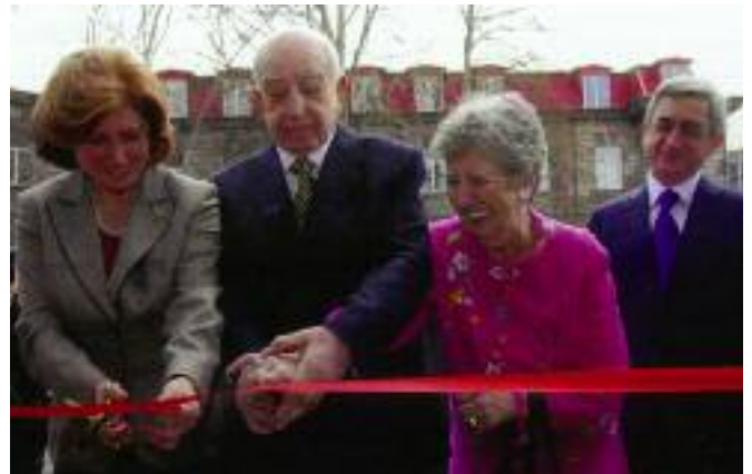
Ձախեն՝ աջ Գոհար Զեալեան (Երեւանի Բժշկական համալսարանի տնօրէն) Նազար եւ Արտեմիս Նազարեաններ եւ ՀՀ Նախագահ Սերժ Սարգսեան:

31 Մարտ 2010-ին բացումը կատարուեցաւ «Լեւոն եւ Գլաուտիա Նազարեան» ճառագայթաբանութեան կեդրոնին: Սոյն կեդրոնը որ միակն է Հայաստանի մէջ, օժտուած է ամենարդիական բժշկական սարքերով եւ մասնագիտական յատուկ փորձաշրջան անցուցած անձնակազմով, որուն շնորհիւ կարելի պիտի ըլլայ բնորոշել ճշգրիտ ախտաճանաչումը զանազան երակային հիւանդութիւններու եւ այսպիսով նուազեցնել կաթուածի պարագաները: