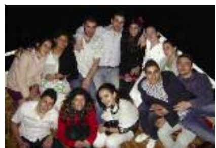
Յիշատակի նկարներ յիշատակելի օրուան մը առիթով