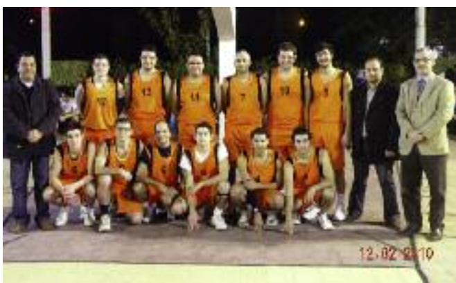
Գահիրէի հաւաքականի խումբը

Առաջին մրցումը տեղի ունեցաւ Ուրբաթ, 12 Փետրուար 2010-ին Գահիրէի ՀՄԸՄ Նուպարի դաշտին վրայ Տախլէյայի խումբին դէմ: