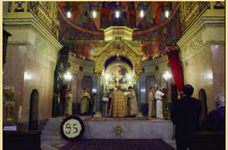
Հանդիսաւոր Ս. Պատարագ